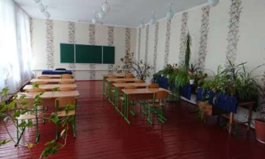
Кабінет української мови та літератури