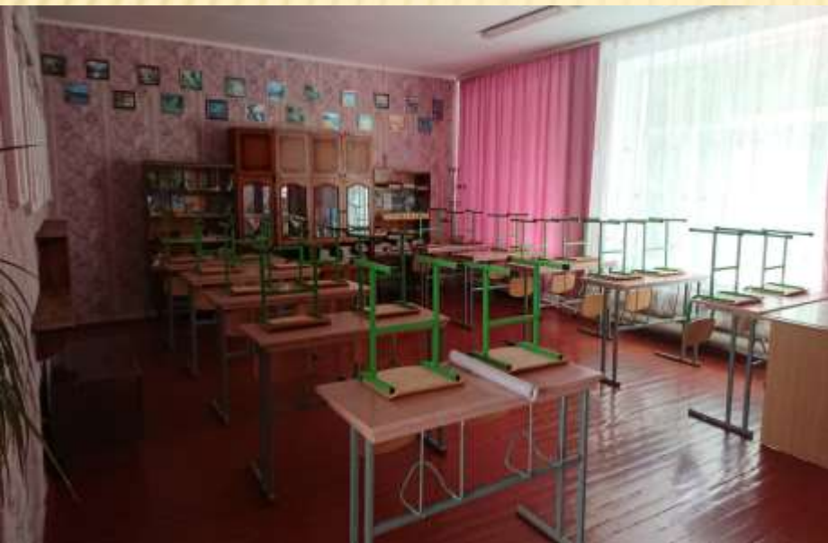
Кабінет світової літератури